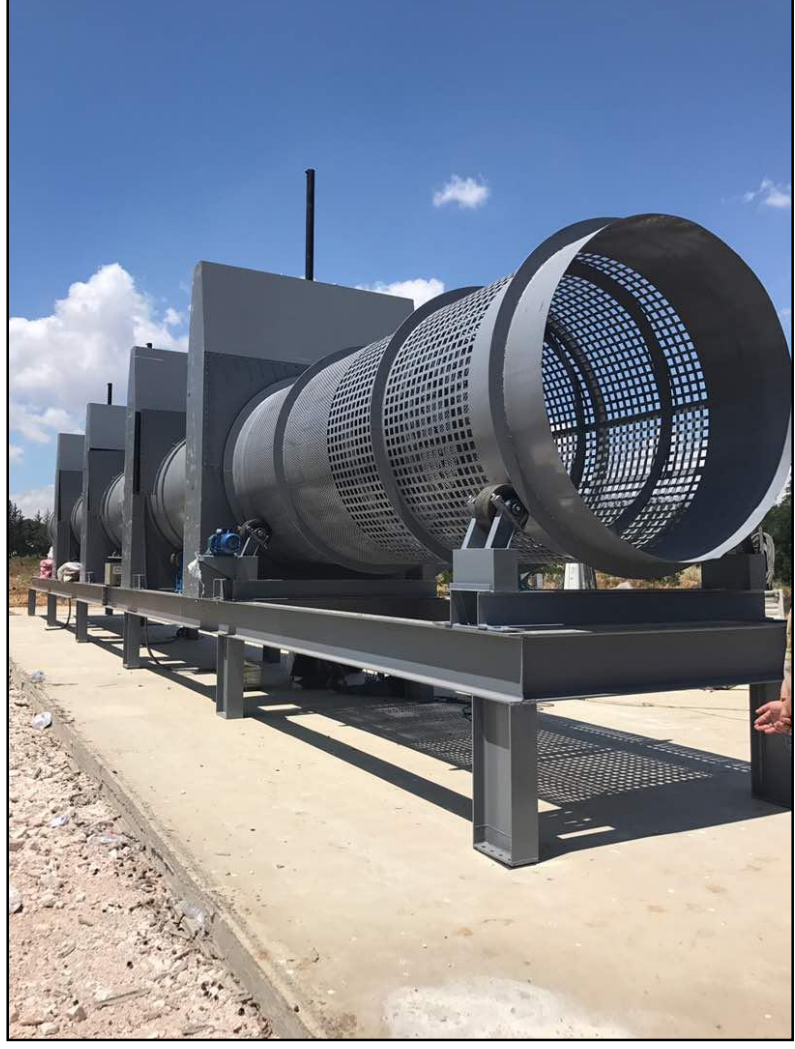
Composting tunnel - Tanail